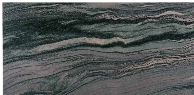
ATLANTIS Quarzite dalla Norvegia Verde, con venature bianche e nere