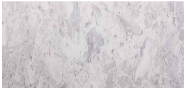
VARIOS Marmo dalla Grecia Marmorizzato, con forti inserimenti di colore grigio