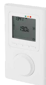
Termostato ambiente radiocomandato

Altre possibilità di regolazione, come il controllo remoto tramite smartphone, sono disponibili su richiesta.