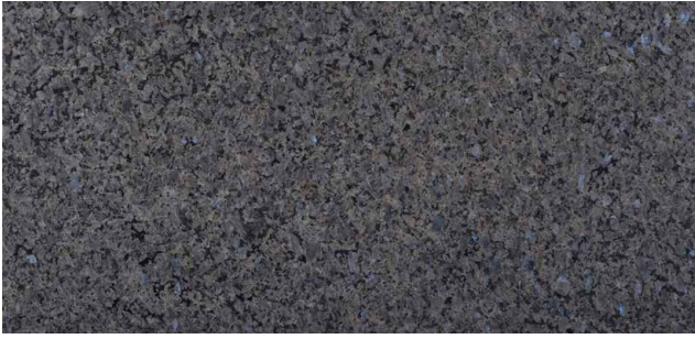
LABRADOR Granito dalla Norvegia Con piccoli inserimenti di colore grigio-blu