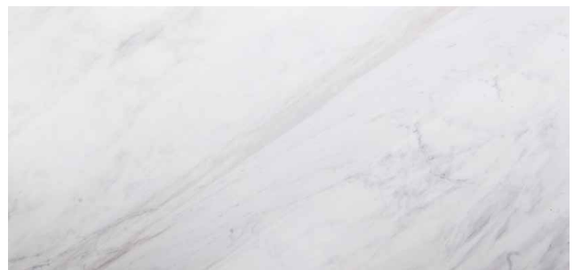
GALAXIS Marmor aus Griechenland Halb-weiss mit grauer Zeichnung