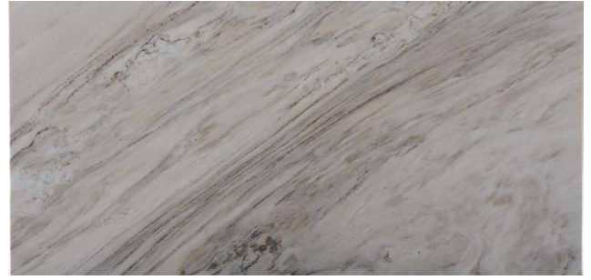
PALISANDRO Marmor aus Italien Bräunlich, mit dunkelbrauner Zeichnung