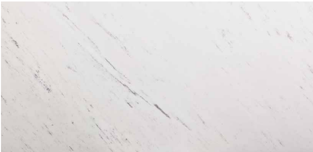
POLARIS Marmor aus Mazedonien Weiss mit grau-schwarzen Stellen