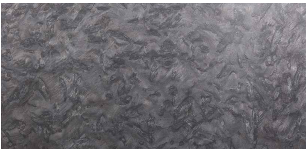
MATRIX* Schiefer aus Brasilien Schwarz mit schillernden Stellen