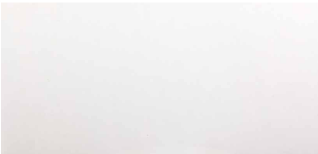
THASSOS Marmor von der griechischen Insel Thassos Weiss, feinkörnig