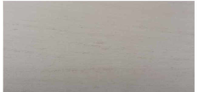
SAHARA Kalkstein aus Portugal Beige mit groben braunen Körnern