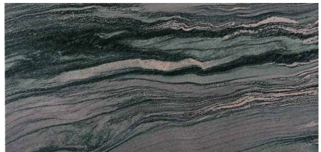
ATLANTIS Quarzit aus Norwegen Grün mit weissen und schwarzen Adern