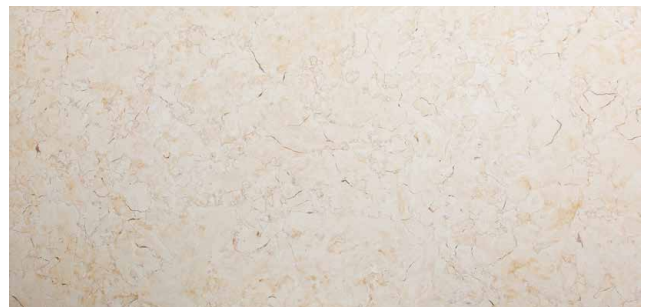
SYLVIA ANTIK* Kalkstein aus Ägypten Antikbeige bis hellbraun, erdige Farben