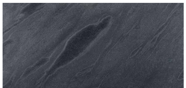
SPECKSTEIN** Metamorphes Gestein aus Finnland Homogen grau