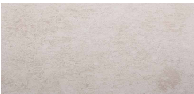
PADUA** Kalkstein aus Bulgarien Warme, cremige Farbe