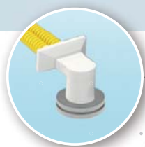
Zuluft über Decke