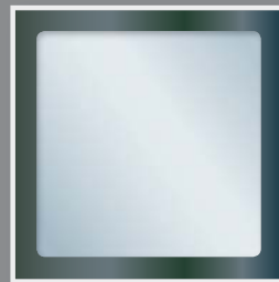
DESIGN frame Bilderrahmen schwarz oder weiß